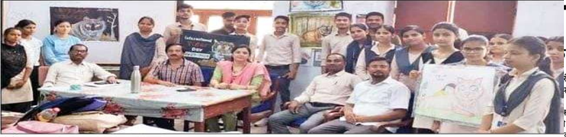
उर्दू: बाघ प्रतियोगिता के दौरान मौजूद शिक्षक व छात्र-छात्राएँ।